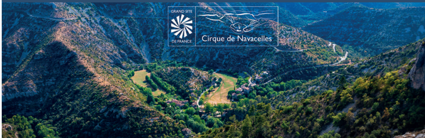
le Cirque de Navacelles

Le label Grand Site de France , porté par le syndicat mixte du Grand Site du Cirque de Navacelles et obtenu pour la première fois en 2017, vient d'être renouvelé par le ministère en charge de la transition écologique. Ce label reconnaît la qualité des actions menées pour la préservation des paysages et la gestion de la fréquentation.