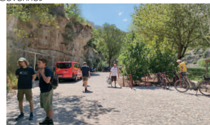
Dispositifs d'accueil : écovolontaires et navettes gratuites Navacelles

Lien vers l'article du ministère en charge de la transition écologique : https://www.ecologie.gouv.fr/actualites/renouvellement-du-label-grand-site-france-cirque-navacelles