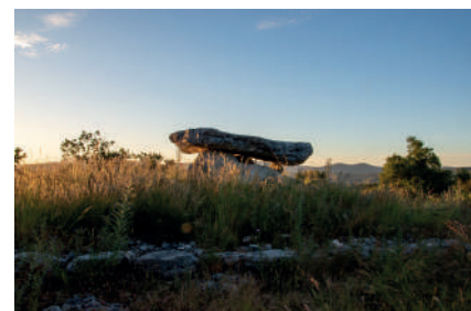
Patrimoine mégalithique - Dolmen de la Prunarde

Le Réseau des Grands Sites de France rassemble des sites ayant reçu le label Grand Site de France et d'autres engagés dans des démarches de développement durable pour l'obtenir.